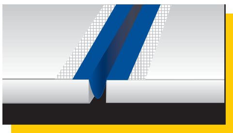
Positionnement en Ω de Mapeband à l'intérieur du joint de dilatation