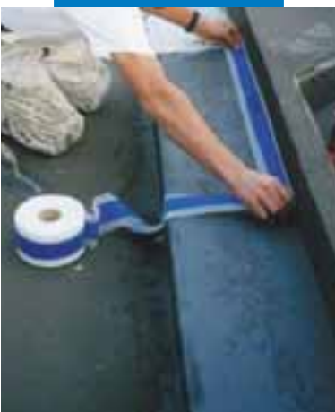
Imperméabilisation avec Mapeband de l'angle entre le fond et la partie d'une baignoire