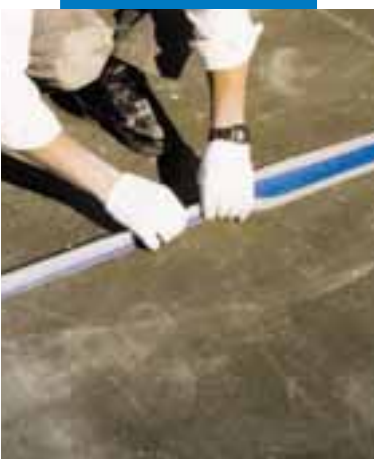
Imperméabilisation d'un joint structurel en terrasse